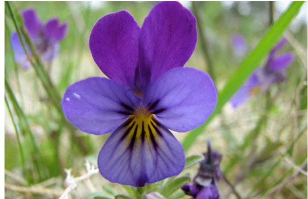
Figur 7. Undersøgelser af makrofossiler har vist, at Alm. Stedmoder ( Viola tricolor ) har levet i Danmark i mindst 4.000 år (Jensen 1985). På trods af at arten desuden er almindelig i mange naturlige kystbiotoper, er den anset for fremmed af nogle forfattere.

Macrofossil evidence shows Viola tricolor to have grown in Denmark for at least 4.000 years (Jensen 1985). Even though it is also common in many natural coastal biotopes, it is regarded as non-native by some authors.